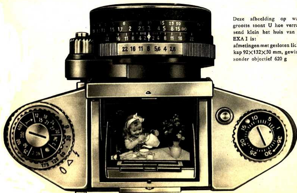
Deze afbeelding op ware grootte toont U hoe verrassend klein het huis van de EXA I is: afmetingen met gesloten lichtkap 92x132x50 mm, gewicht zonder objectief 620 g

Als U de voorkeur geeft aan bewegende objecten, snapshots en zeer levendige opnamen van personen, dan verdient het zo nu en dan aanbeveling de EXA I met prismazoeker te gebruiken (z. afbeelding op omslag). Hierdoor is het mogelijk om met de camera voor het oog, het motief via de zoeker direct vast te houden en bij staande- en liggende opnamen met een niet links-rechts verwisseld, rechtopstaand en ruim 4x vergroot zoekerbeeld te fotograferen. Bewegingen hebben in dit zoekerbeeld dezelfde richting als in werkelijkheid, en U kunt ook snel bewegende objecten steeds precies volgen om dan op het juiste moment de opname te maken. Het verwisselen van de lichtkap- tegen de prismazoeker en omgekeerd is slechts kwestie van een ogenblik. Men kan dus steeds dat instelsysteem kiezen, dat een gemakkelijker fotograferen en een betere foto waarborgt!