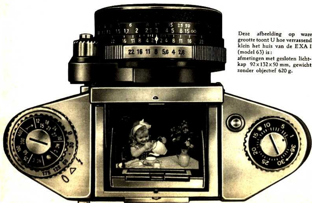
Deze afbeelding op ware grootte toont U hoe verrassend klein het huis van de EXA I (model 63) is: afmetingen met gesloten lichtkap 92x132x50 mm, gewicht zonder objectief 620 g.

Als U de voorkeur geeft aan bewegende objecten, snapshots en zeer levendige opnamen van personen, dan verdient het zo nu en dan aanbeveling de EXA I met prismazoeker te gebruiken (z. afbeelding op omslag). Hierdoor is het mogelijk om met de camera voor het oog, het motief via de zoeker direct vast te houden en bij staande- en liggende opnamen met een niet links-rechts verwisseld, rechtopstaand en ruim 4x vergroot zoekerbeeld te fotograferen. Bewegingen hebben in dit zoekerbeeld dezelfde richting als in werkelijkheid, en U kunt ook snel bewegende objecten steeds precies volgen om dan op het juiste moment de opname te maken. Het verwisselen van de lichtkap-tegen de prismazoeker en omgekeerd is slechts kwestie van een ogenblik. Men kan dus steeds dat instelsysteem kiezen, dat een gemakkelijker fotograferen en een betere foto waarborgt!