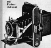
Auto-Ultrix mit Plattenrückwand

Erklärung der Verschlüsse: Verschluss V = Zeit und Moment \frac{1}{125} – \frac{1}{1000} Sek. Verschluss P = Zeit und Moment \frac{1}{125} – \frac{1}{1000} Sekunde mit Selbstauslöser. Verschluss P II = Prontor II für Zeit und Moment 1 – \frac{1}{1000} Sek. mit Selbstauslöser. Verschluss C = Compur-Verschluss für Zeit und Moment 1 – \frac{1}{1000} Sek. Verschluss SC = Compur-Verschluss für Zeit u. Moment 1 – \frac{1}{1000} Sek. mit Selbstauslöser.