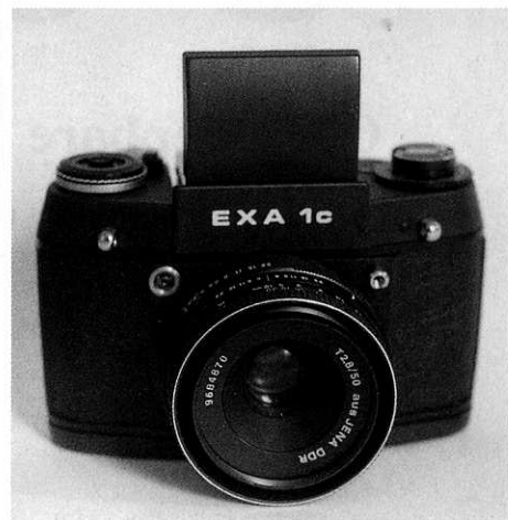
Laatste model tot omstreeks 1989