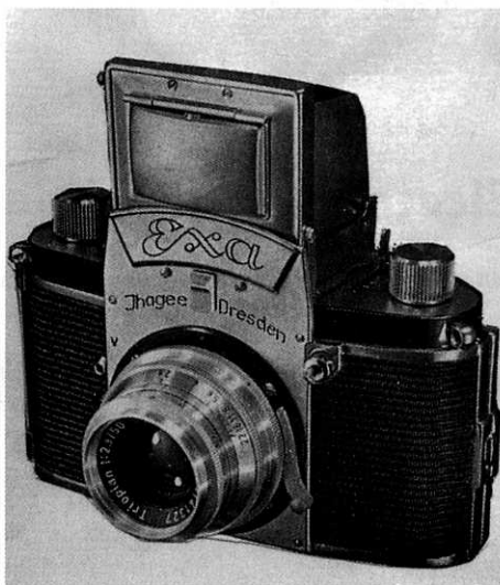
Eerste verkoopmodel de EXA uit 1950

Na dit eerste model kwamen veel vervolgmogelommen en het is toch verbazingwekkend dat zo'n simpele camera tot 1989, dus 40 jaar lang, met alleen detailwijzigingen in productie is gebleven. Het totaal geproduceerde aantal van omstreeks één miljoen stuks is best respectabel.